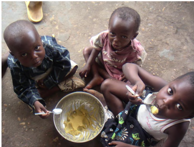
Vooraf dank zij de sojapap (mengeling van maïs-en sojameel) herstellen ondervoede kinderen vlug

Kerstlichtje 1: Een straatkind dat een tijdje in ons onthaalhuis had doorgebracht maar verkoos ons te verlaten om weer te gaan genieten van het vrije straatleven, stond op een dag aan onze ingangspoort met een jonge uitgeteerde moeder en haar ziek kindje in vuile lappen gewikkeld. Hij had haar op de markt gevonden waar ze op de grond zat met haar kindje op haar schoot, en aalmoezen vroeg. En die kleine begreep haar ellende, kreeg medelijden en bracht haar naar ons centrum waar hij van wist dat ze er zeker zou opgevangen worden.