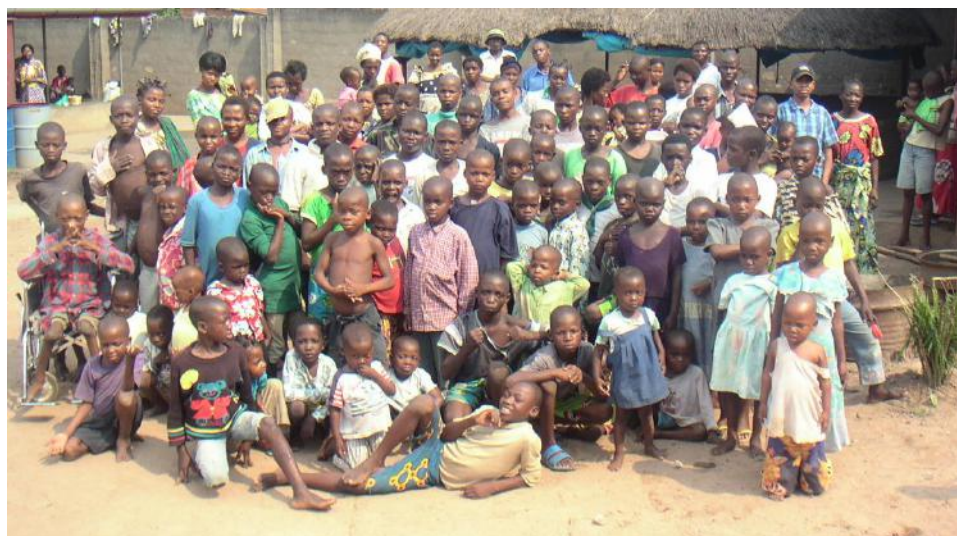
Groot en klein verblijven in Bron van Leven als een grote familie.

Ons Onthaalhuis voor Mensen in Nood "Bron van Leven" blijft sinds enkele jaren te klein. Van januari tot nu hebben we gemiddeld meer dan 66 mensen per maand opgevangen. Dit betekent 800 mensen dit jaar, waarvan 80 % kinderen. De meeste kunnen we na een tijdje in hun familie terecht brengen, waar